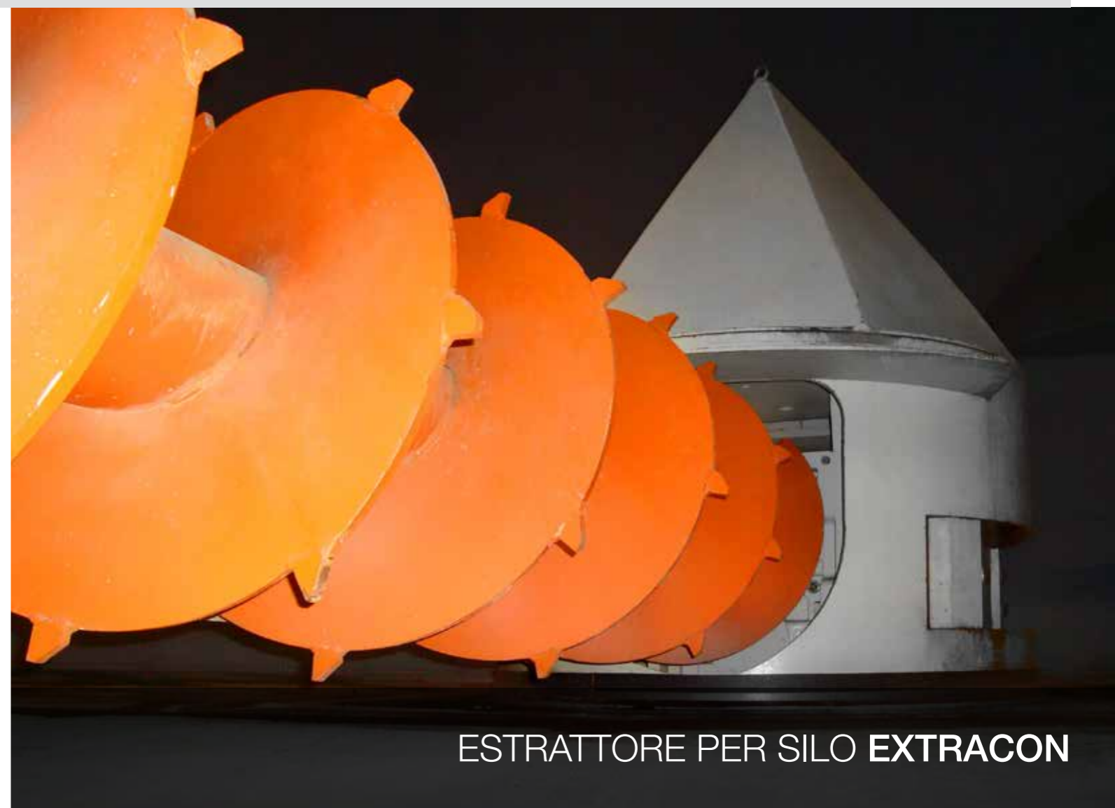
ESTRATTORE PER SILO EXTRACON

Via Malignani, 25 33050 CASTIONS DI STRADA (UD) • ITALY Phone: +39.0432.768 440 Fax : +39.0432.769 067 E-mail: info@pmi-srl.it Website: www.pmi-srl.it